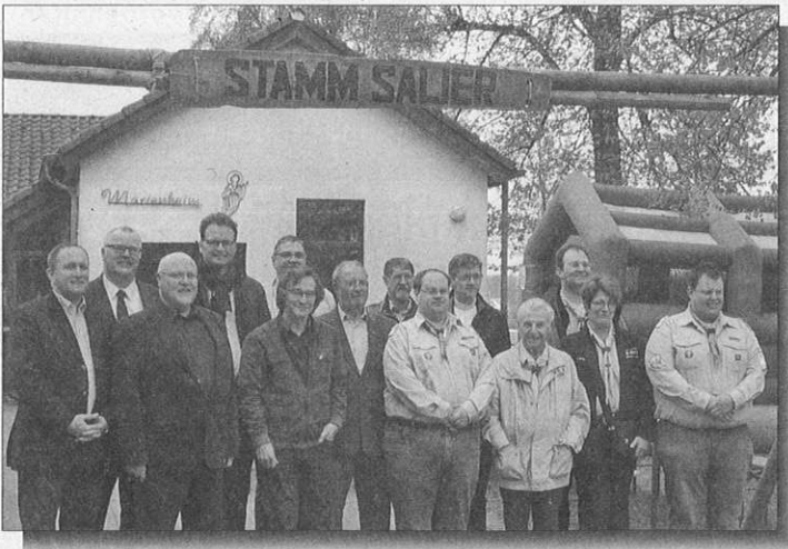
Vorstandsmitglieder und geladene Gäste beim Geburtstagsempfang „60 Jahre“ Pfadfinder-Stamm Salier Meerkamp am 27. April 2013.

Im weiteren Tagesverlauf wurde ein buntes Programm rund um die Pfadfinderei angeboten (Schaulager, Diaschau und Ausstellung mit Dokumenten aus 60 erlebnisreichen Salier-Jahren). Gemeinsam feierte man einen Gottesdienst in der Pfarrkirche St. Mariä Himmelfahrt Meerkamp. Der Förderverein verwöhnte die Pfadfinder und deren Gäste mit Leckereien vom Grill und einem gemütlichen Umtrunk.